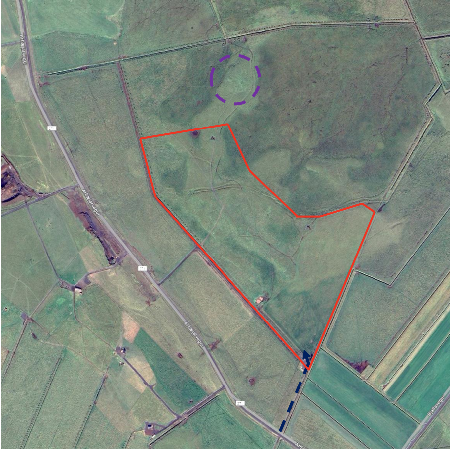
MYND 1. Skipulagssvæðið er innan rauða flákans. Aðkoman er blámerkt með brotalínum. Minjar eru innan fjólubláu brotalínanna.