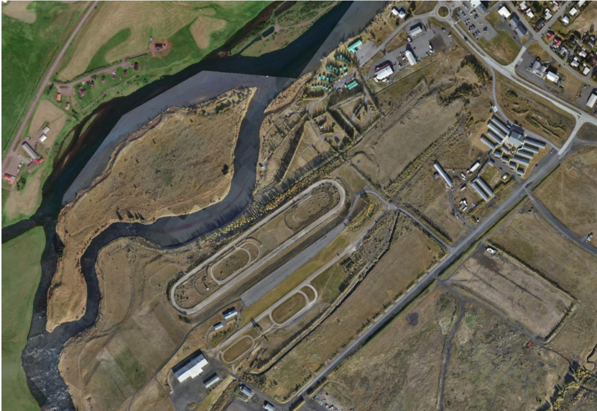
MYND 1. Gaddstaðaejja í Ytri-Rangá.

Nokkuð vinsæl gönguleið er á austurbakka Ytri-Rangár, frá miðbæ Hellu og suður að Ægissíðufossi.