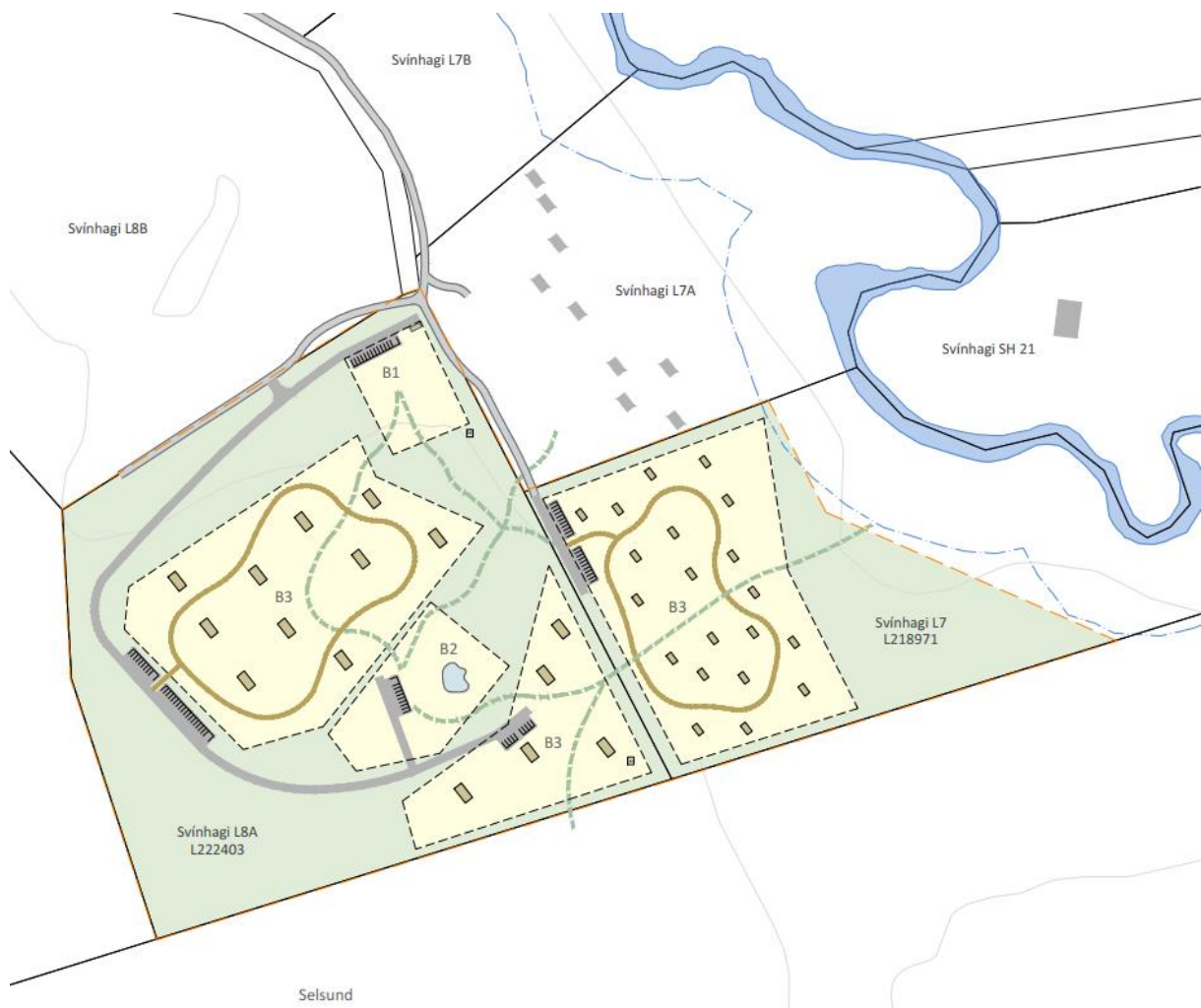
MYND 6. Dæmi um mögulega uppröðun húsa á svæðinu, akvega og gönguleiða. Á efra svæðinu eru sýnd 15 gistihús, 50 m 2 hvert, en á neðra svæðinu eru sýnd 20 gistihús, 20 m 2 hvert. Um er að ræða dæmi um mögulega staðsetningu og stærð bygginga innan byggingarreita en ekki endanlega útfærslu.