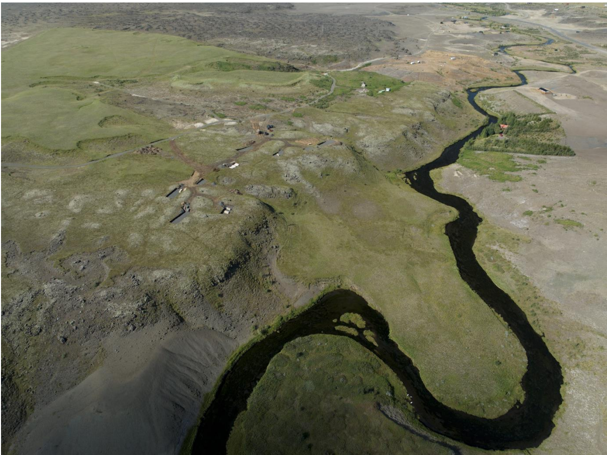
MYND 4. Yfirlitsmynd yfir svæðið, horft til vesturs yfir Selsundslæk. Rask sem sést er á landi Svínhaga L7A.