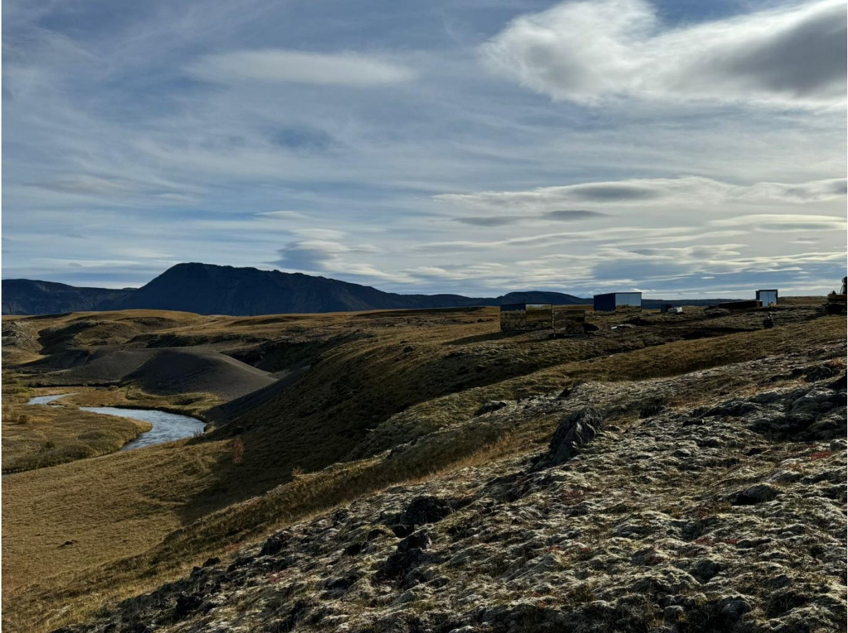
MYND 3. Tölvugerð mynd af mögulegri uppbyggingu. Útlit og staðsetning húsanna er sett fram til að gera hugmynd um hvernig svæðið gæti komið til með að líta út en er ekki bindandi.