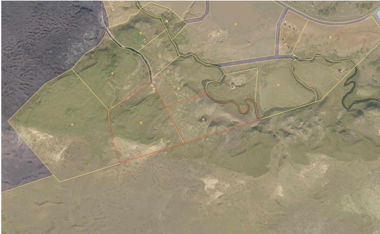
Mynd 2. Yfirlitsmynd af vef HMS. Lóðirnar eru merktar með rauðu.

Aðkoma að landinu er frá Þingskálavegi (nr. 268) um aðkomuveg sem liggur vestan og samsíða Selsundslæk. Svæðið kemur til með að tengjast dreifikerfi RARIK og vatnsveitu Heklubýggðar. Nánari skilmálar verða settir fram í deiliskipulagi fyrir svæðið.