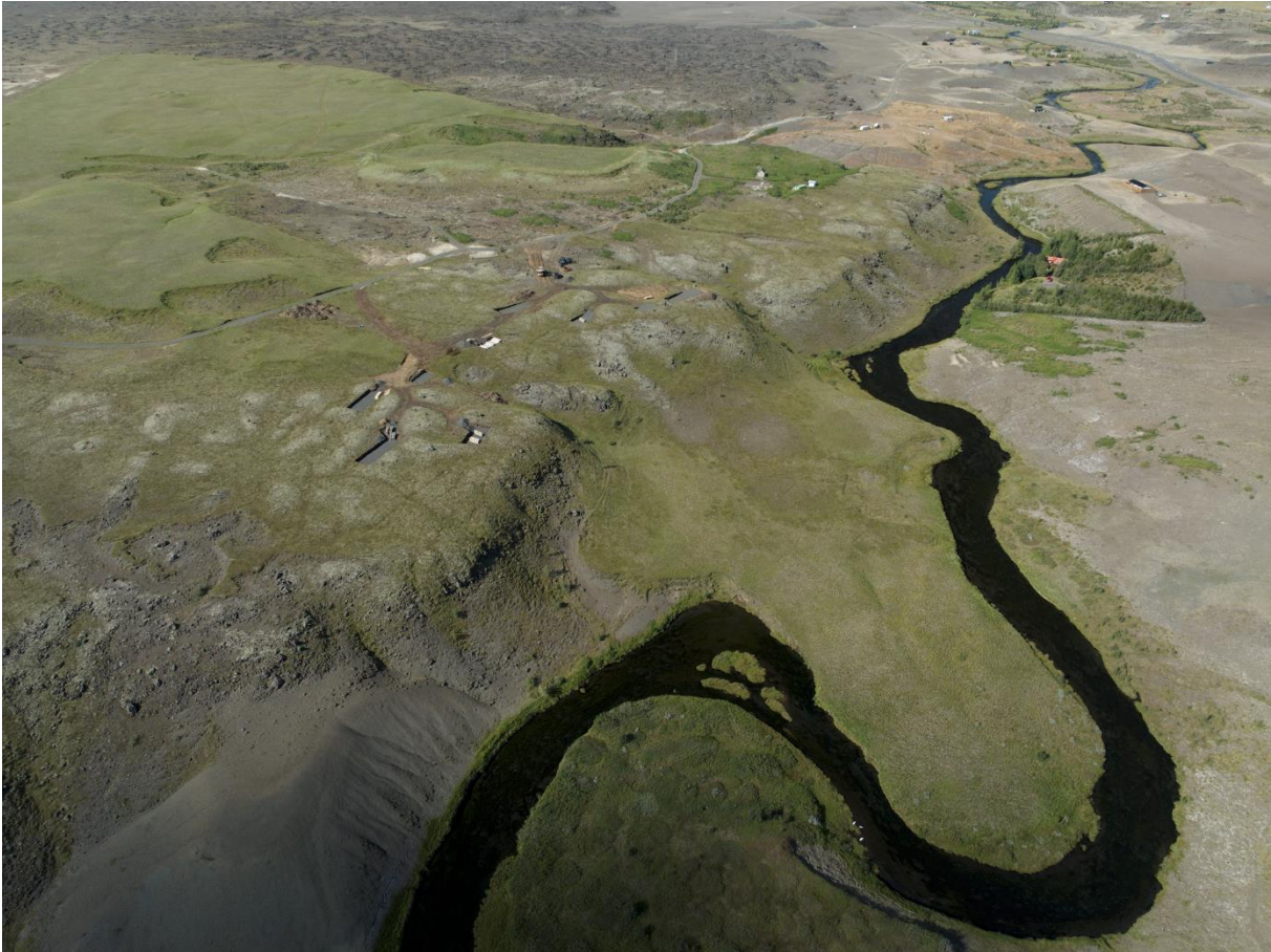
MYND 1. Yfirlitsmynd yfir svæðið, horft til norðvesturs eftir Selsundslæk.

Svæðið er rúmgott fyrir fyrirhugaða uppbygginu og verður því nokkurt rými á milli húsa til að tryggja næði. Reynt verður að viðhalda núverandi gróðri og ganga vel frá svæðinu að framkvæmdum loknum. Með uppbyggingunni er vonast eftir að skapa áhugaverða og aðlaðandi gístaðstöðu fyrir ferðamenn í efri byggðum sveitarfélagsins.