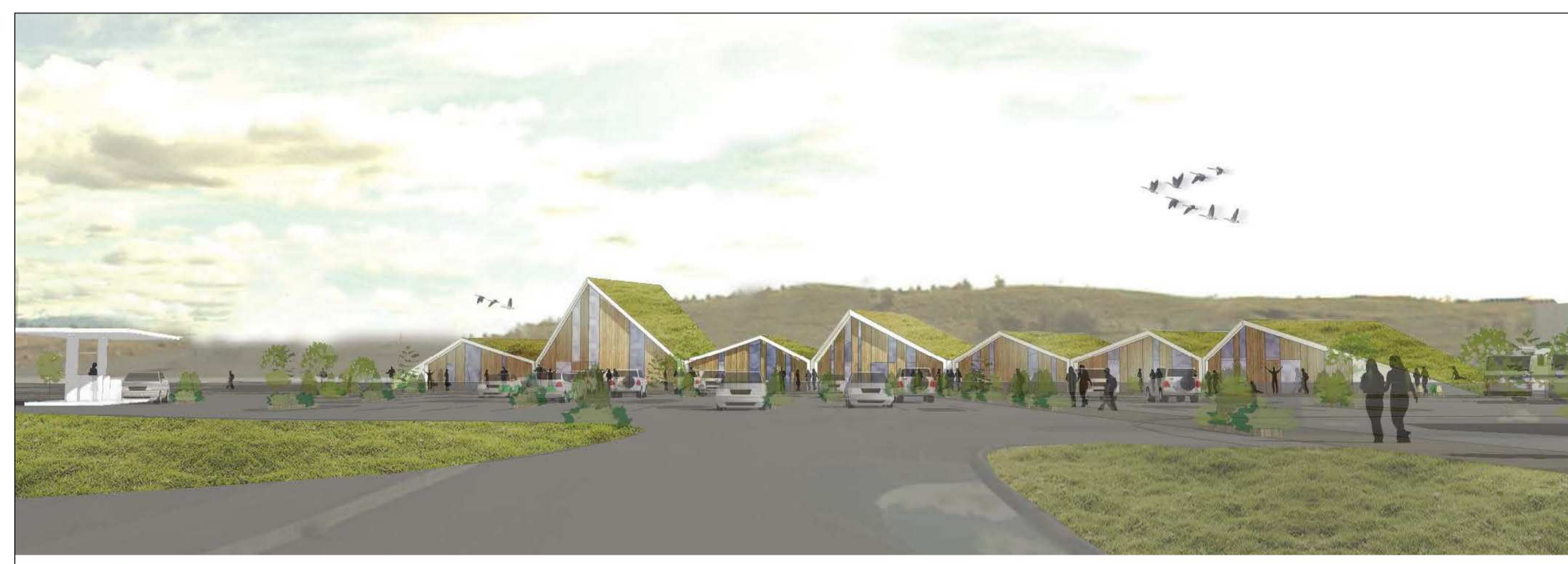
Fjarvidd Horft til suðausturs frá Rangárbakka