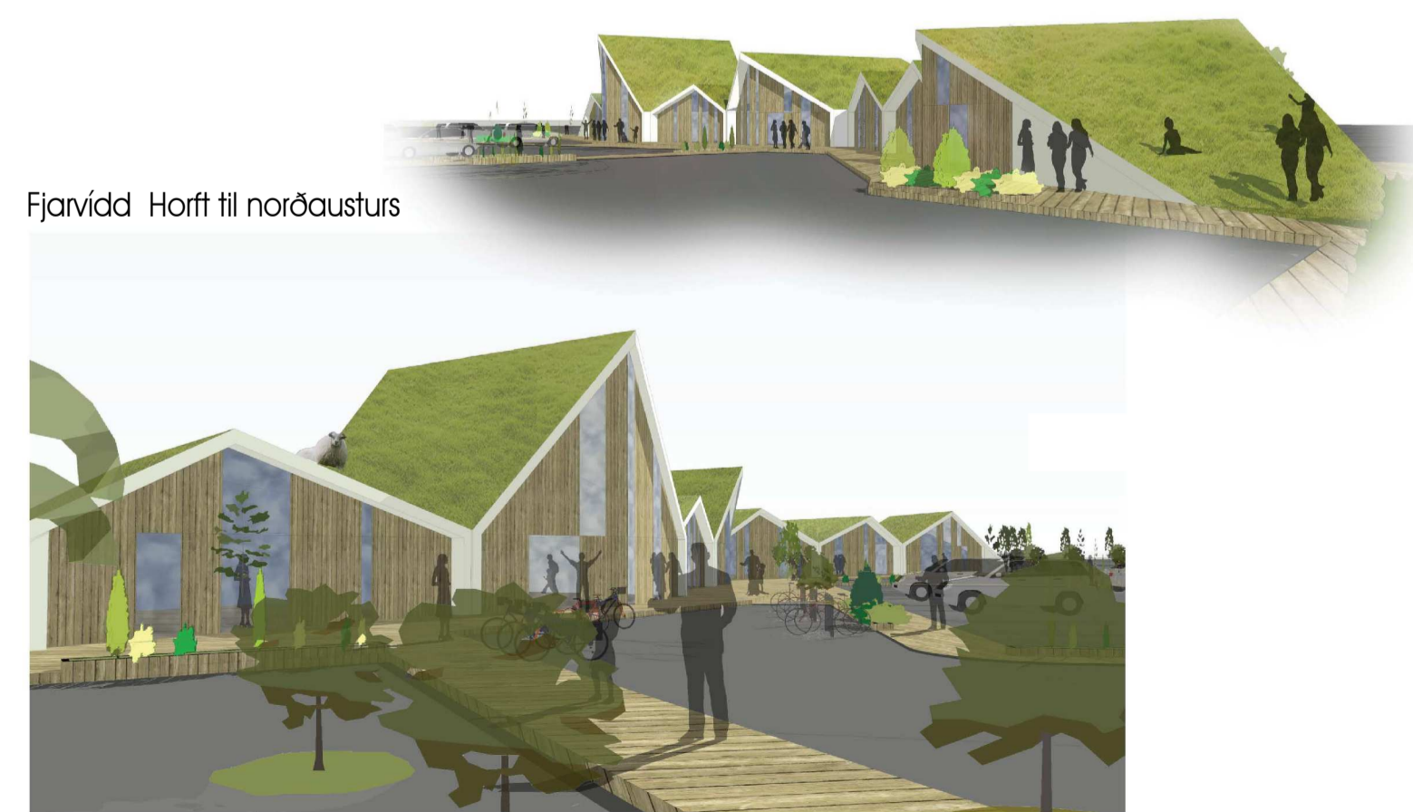
Fjarvidd Horft til norðausturs