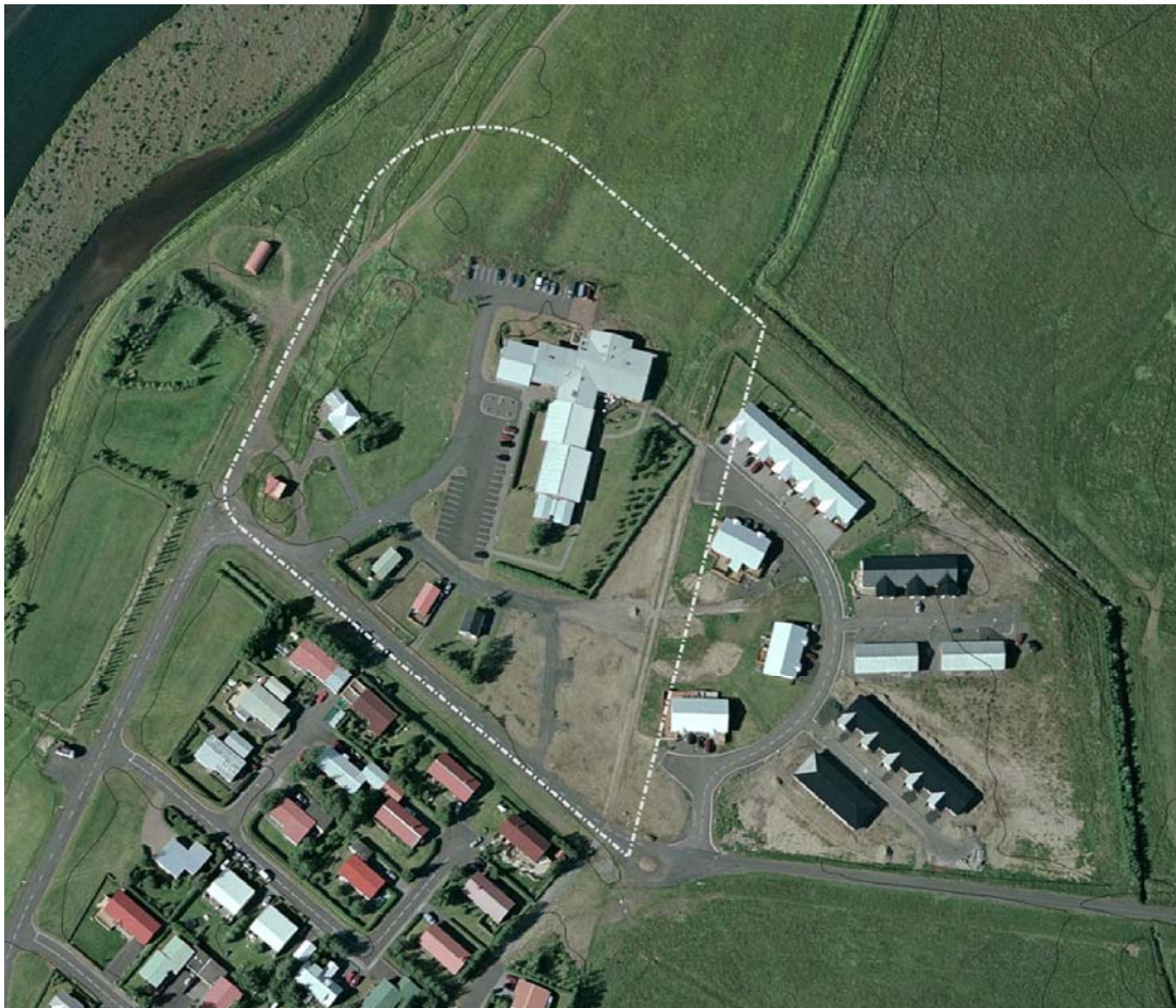
Mynd 1. Lundur – fyrirhugað skipulagssvæði.

Áætluð er frekari uppbygging Lundar til að mæta auknum kröfum varðandi aðbúnað samhliða því að bæta þjónustu við íbúana. Gert verður ráð fyrir að byggja við núverandi hjúkrunarheimili og koma upp þjónustuíbúðum fyrir aldraða, öryrkja og fatlaða í nágrenninu sem nýtt geta þjónustu hjúkrunarheimilisins.