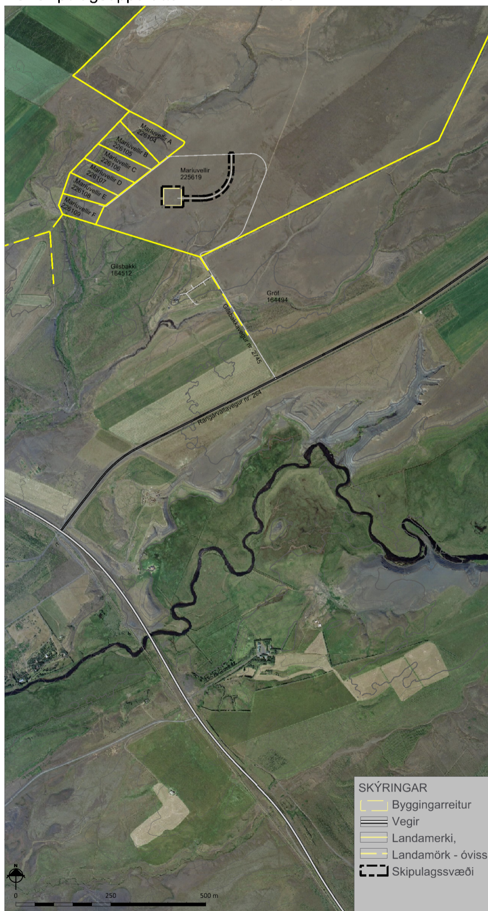
Skýringruppdráttur í mkv. 1:10.000