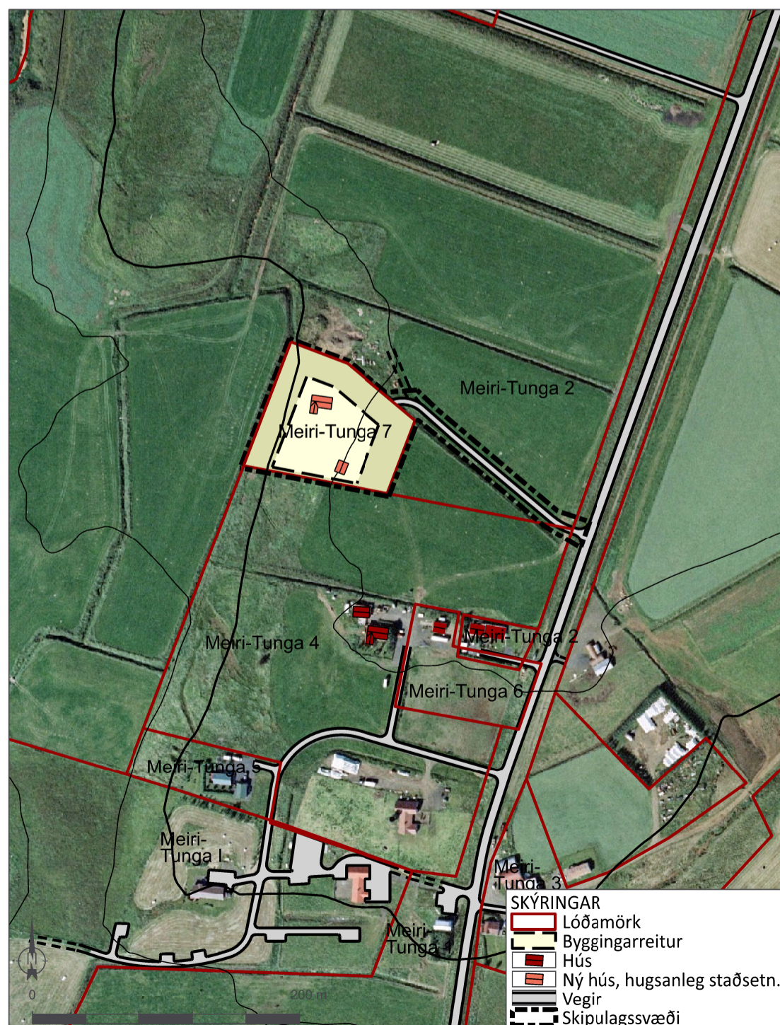
Skýringaruppráttur í mkv. 1:4.000.