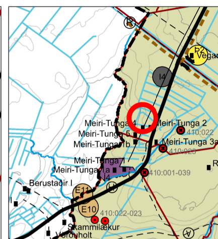
Aðalskipulag Rangárþings ytra 2010-2022, í mkv. 1:50.000.