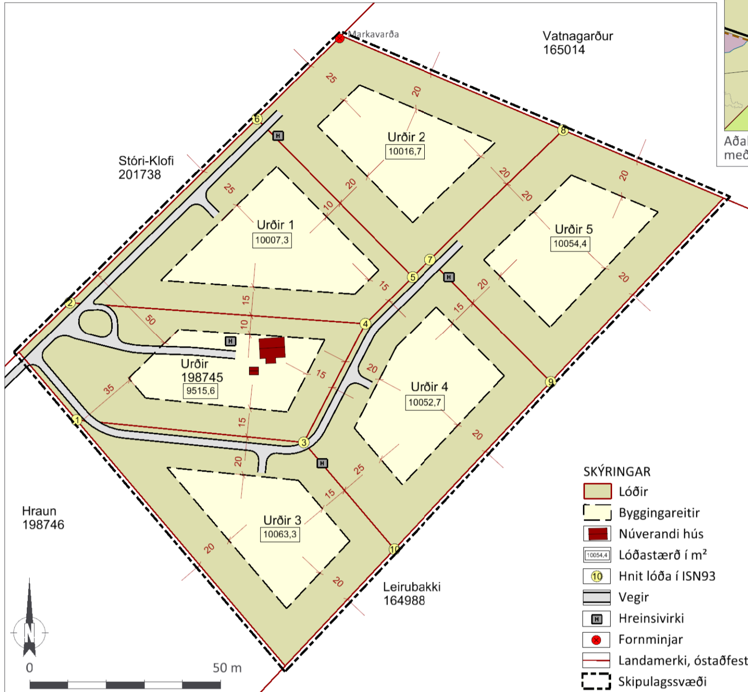
Deiliskipulagsuppráttur í mkv. 1:2.000.