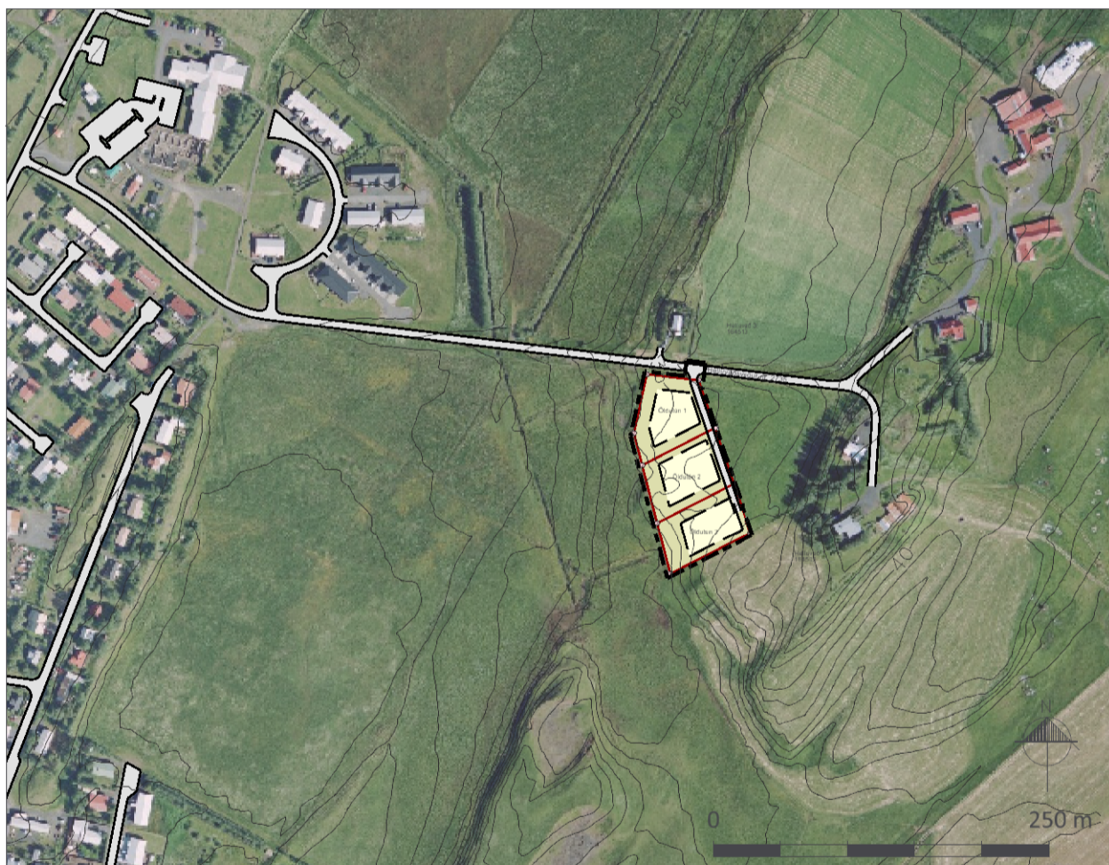
Skýringaruppráttur í mkv. 1:5.000.

Ýmis grunnöggn frá sveitarfélaginu. Loftmynd og hæðarlínur frá Loftmyndum ehf. Hnit eru í ISN93.