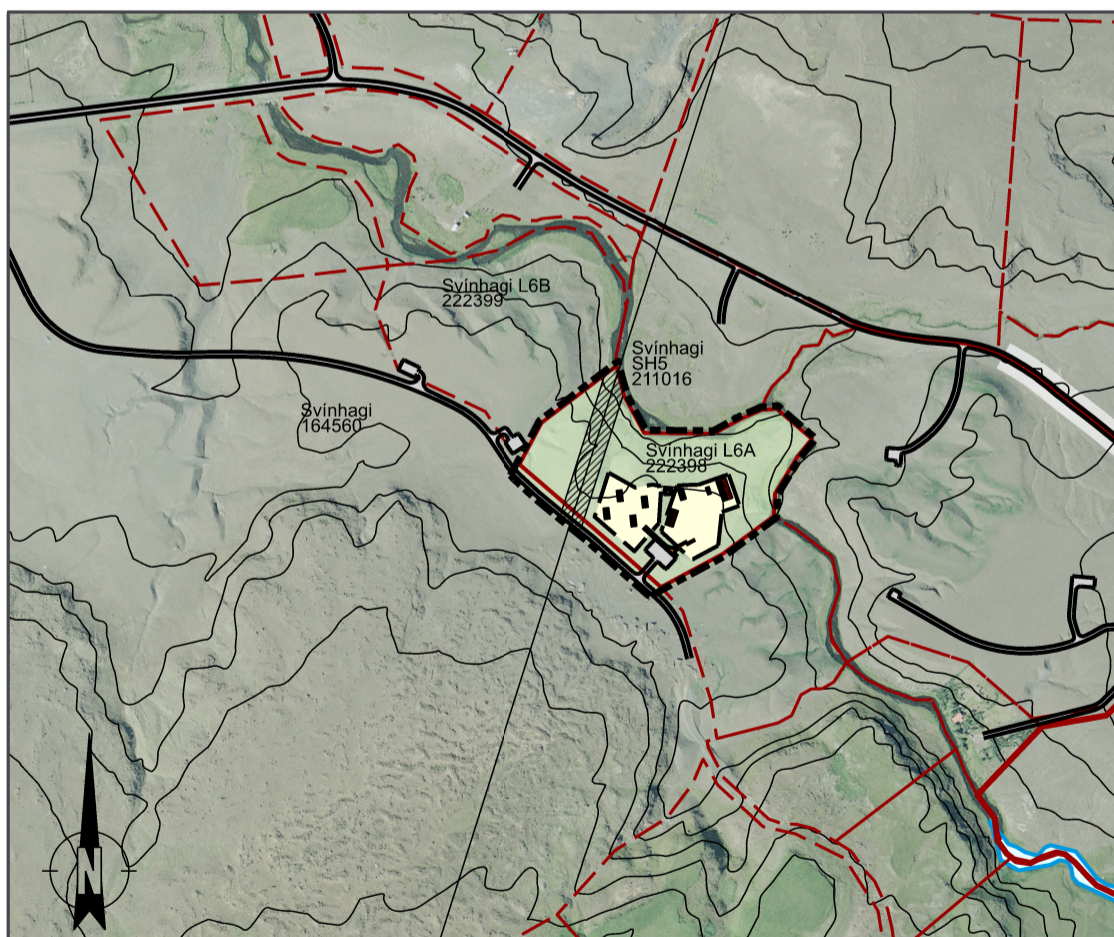
Skýringaruppráttur í mkv. 1:8.000.