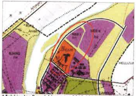
Aðalskipulag Rangárþings ytra 2010-2022 á Hellu. Mkv. 1: 10.000.