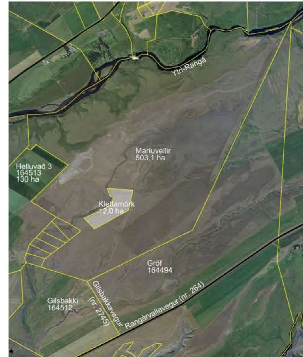
Mariuvellir 1 : 30.000