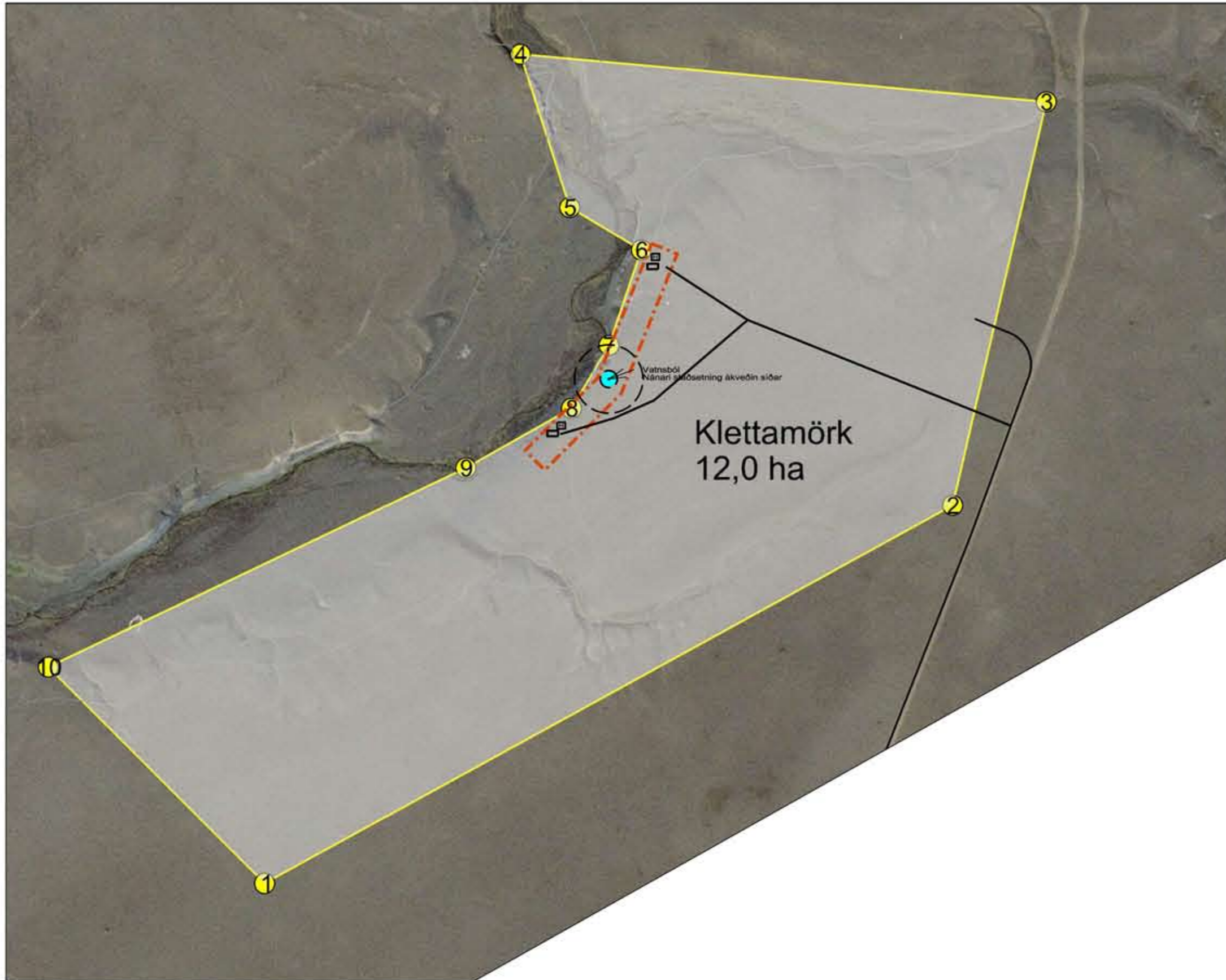
Klettamörk, afmörkun byggingarreits