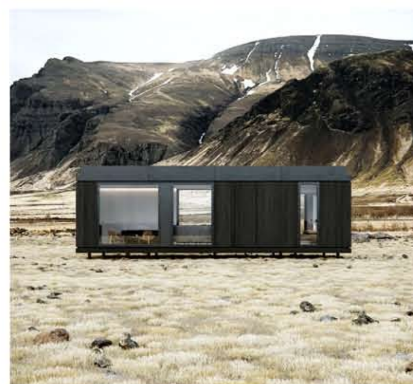
Tillaga að húsum