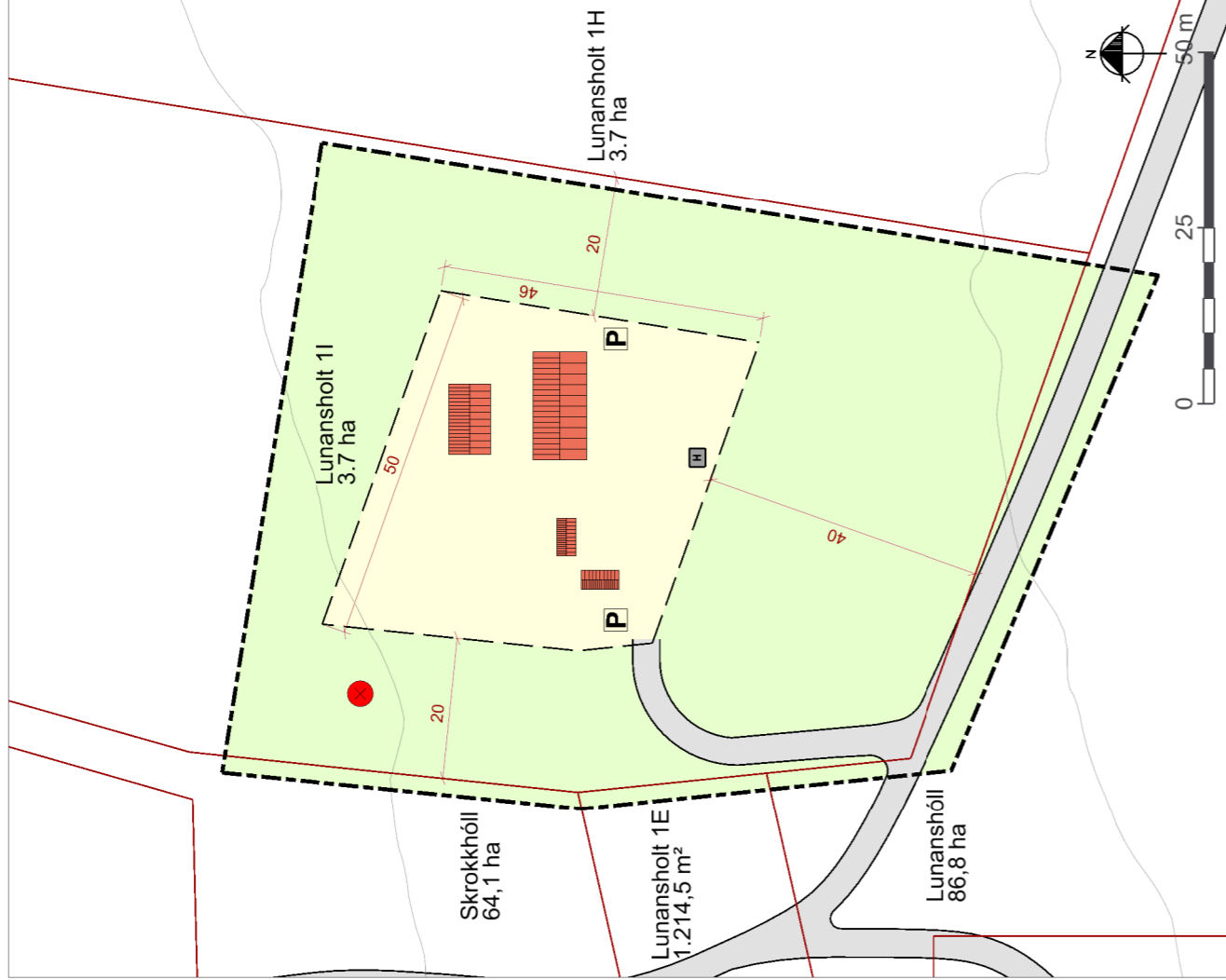
Deiliskipulagsuppráttur í mkv. 1:1.000.