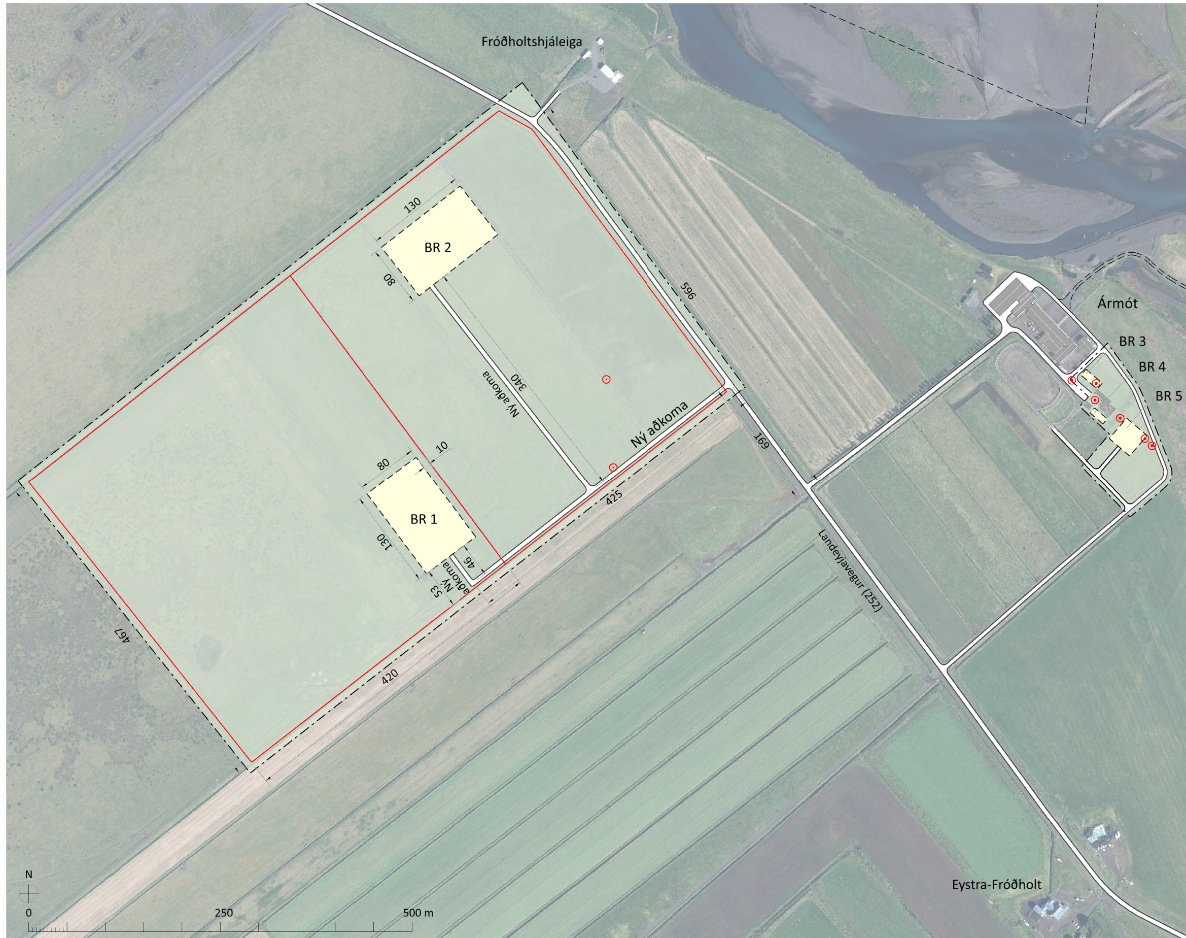
DEILISKIPULAGSUPPRÁTTUR - ALLT SVÆÐIÐ 1:5.000