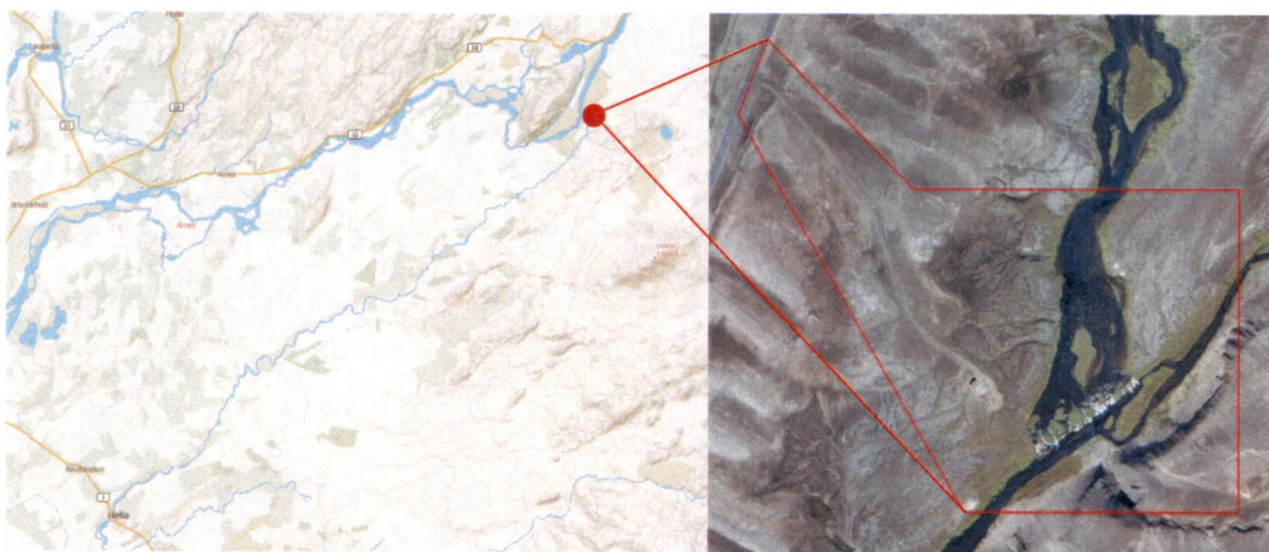
Mynd 2. Afmörkun deiliskipulagssvæðisins.

Deiliskipulagssvæðið hefur ekki afmörkun í landeignaskrá fasteigna en er um 1 ha að stærð og liggur austan við Landveg (nr. 26).