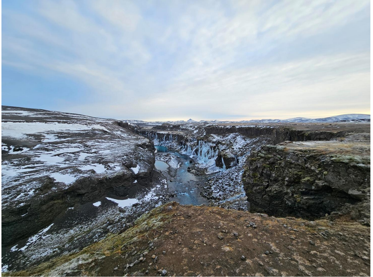
Frá Sigöldugljúfri