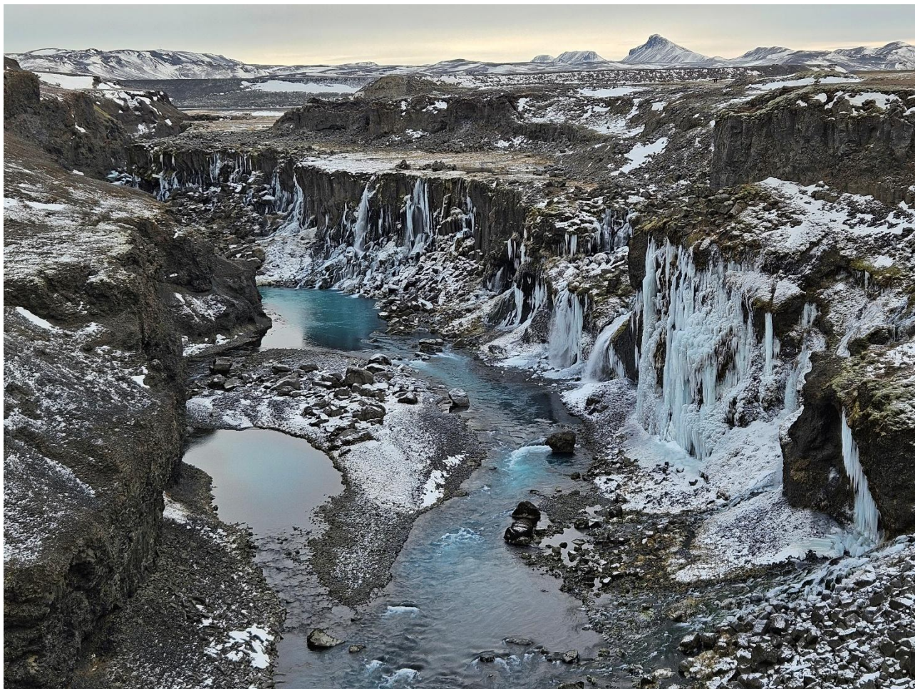
Frá Sigöldugljúfri, mynd Finnur Kristinsson, Landslag ehf.