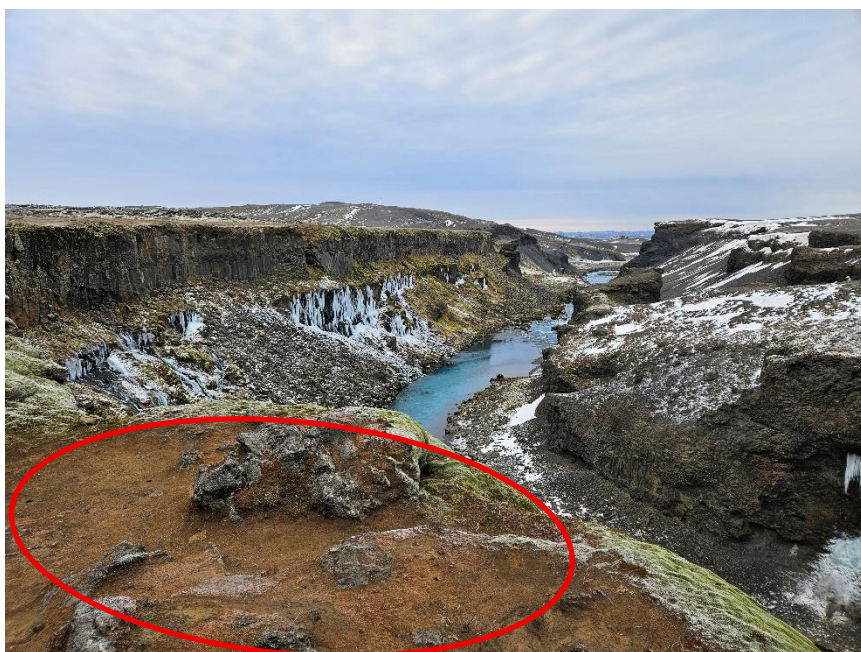
Slit á gróðri við einn af útsýnisstöðunum

Í dag fer fólk að svæðinu með því að keyra vinnuslóða sem liggur í gegnum svæðið að mannvirkjum Landsvirkjunar við uppistöðulónið. Engir stígar eða bílastæði eru á svæðinu í dag og má sjá merki þess að svæðið er farið að raskast og gönguslóðar farnir að myndast víða um svæðið. Einnig eru merki þess að fólk fari ofan í gljúfrið sjálft.