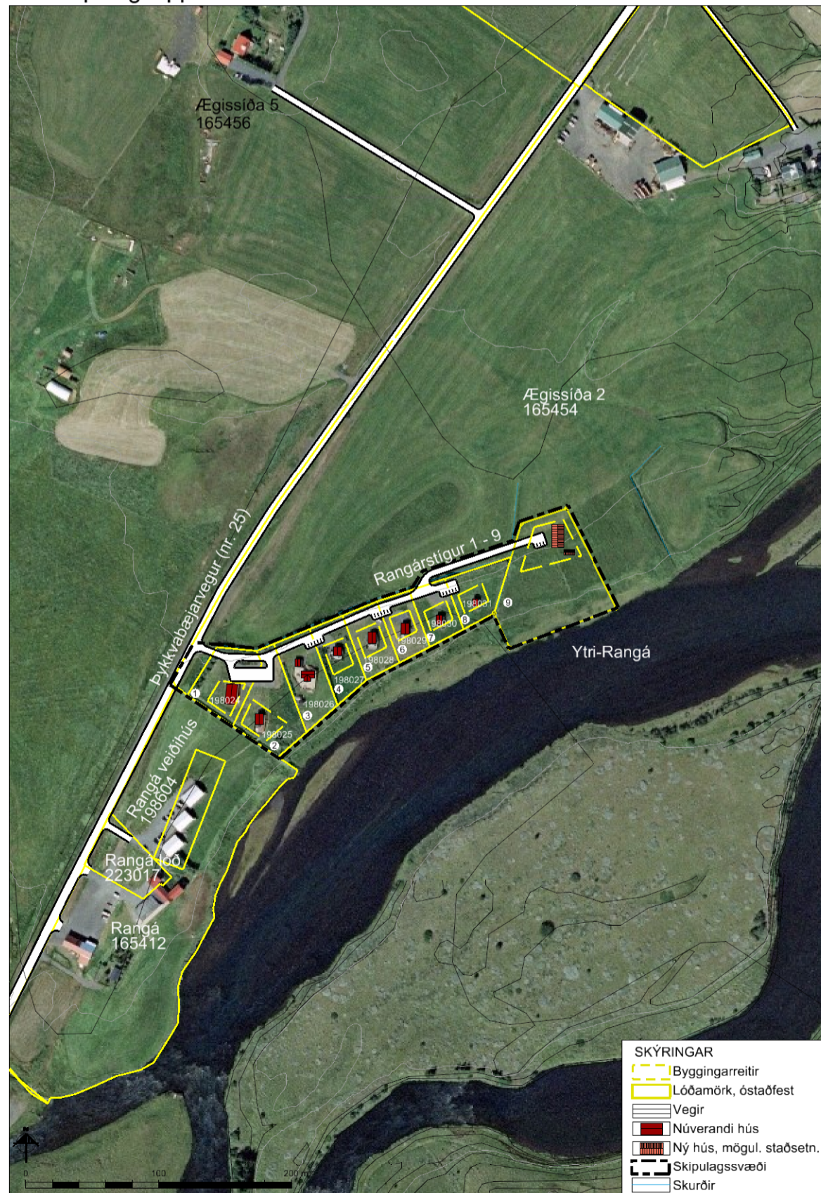
Skýringaruppráttur í mkv. 1:4.000