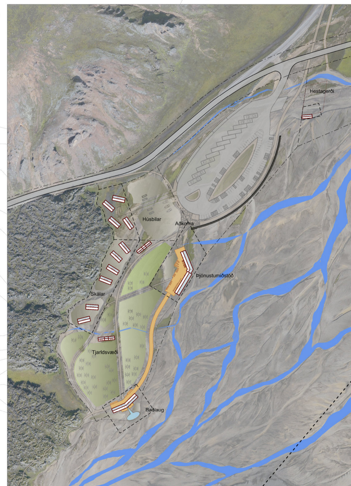
Skýringarmynd B Þjónustusvæði norðan Námshrauns

Deiliskipulag þetta sem fengið hefur meðferð í samræmi við ákvæði 41. gr. skipulagslaga nr. 123/2010 var samþykkt í _____ þann _____ 2017 og í sveitarstjórn Rangárbings ytra þann _____ 2017.