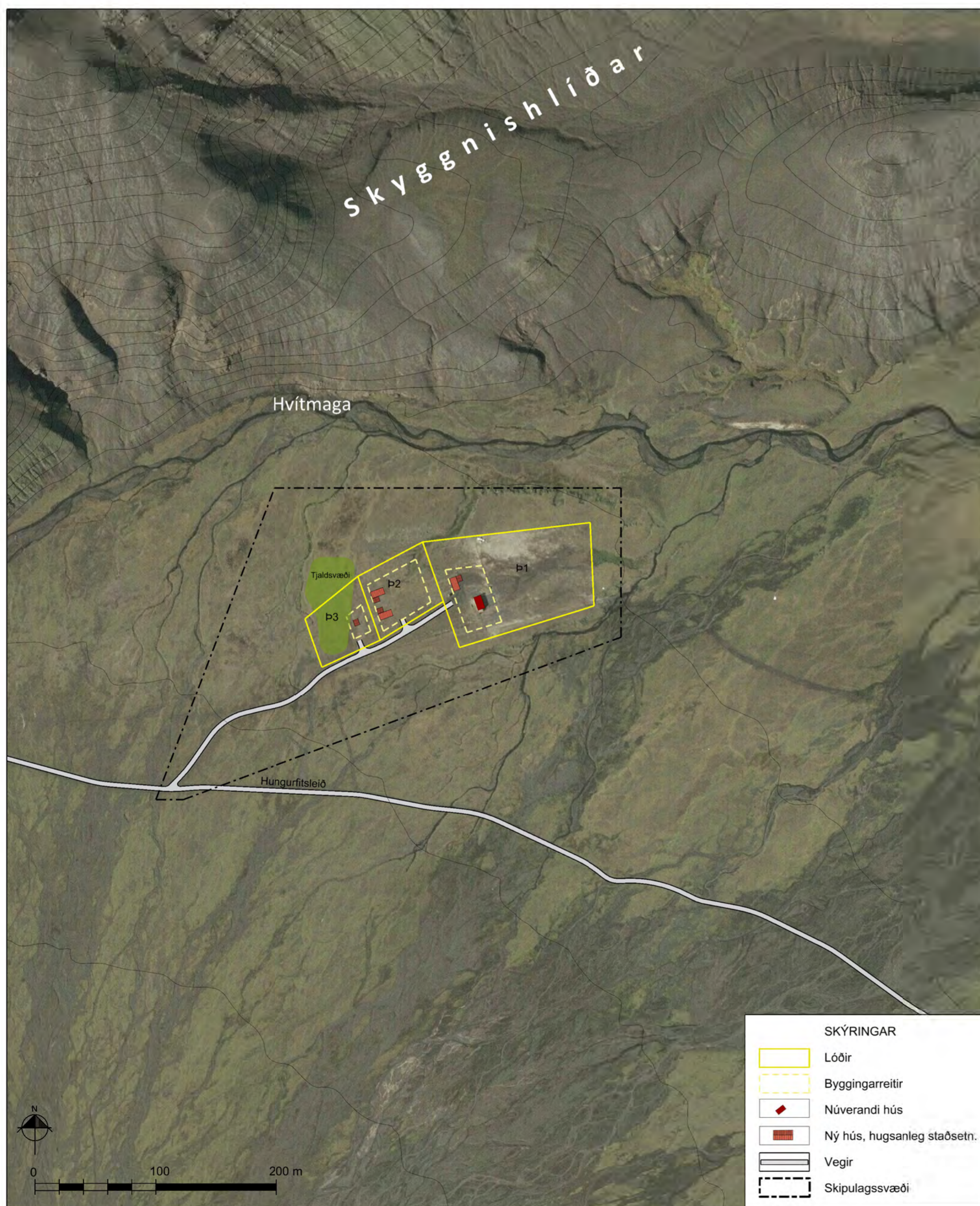
Skýringaruppráttur, mkv. 1:3.000.