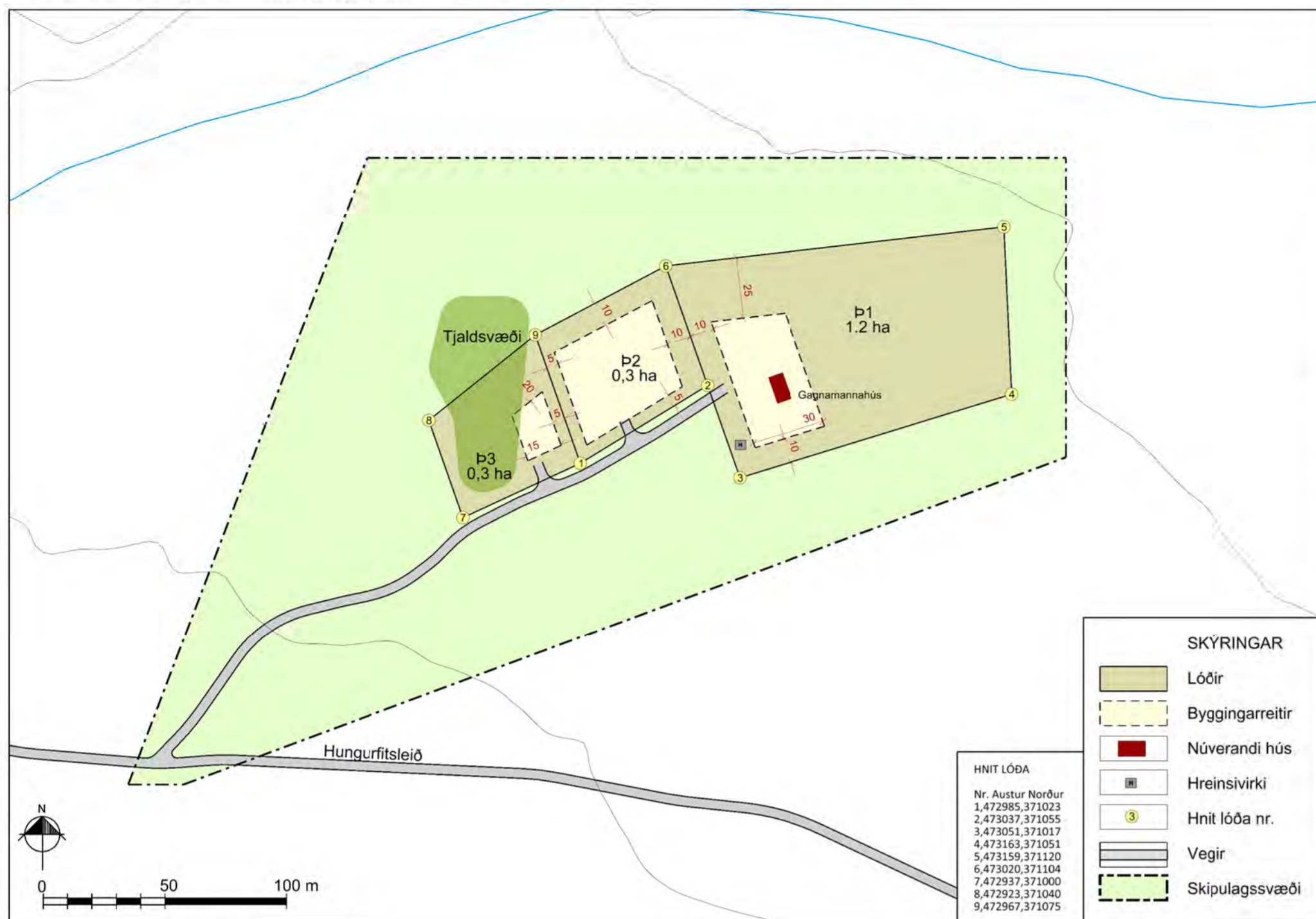
Deiliskipulagsuppráttur, mkv. 1:2.000.