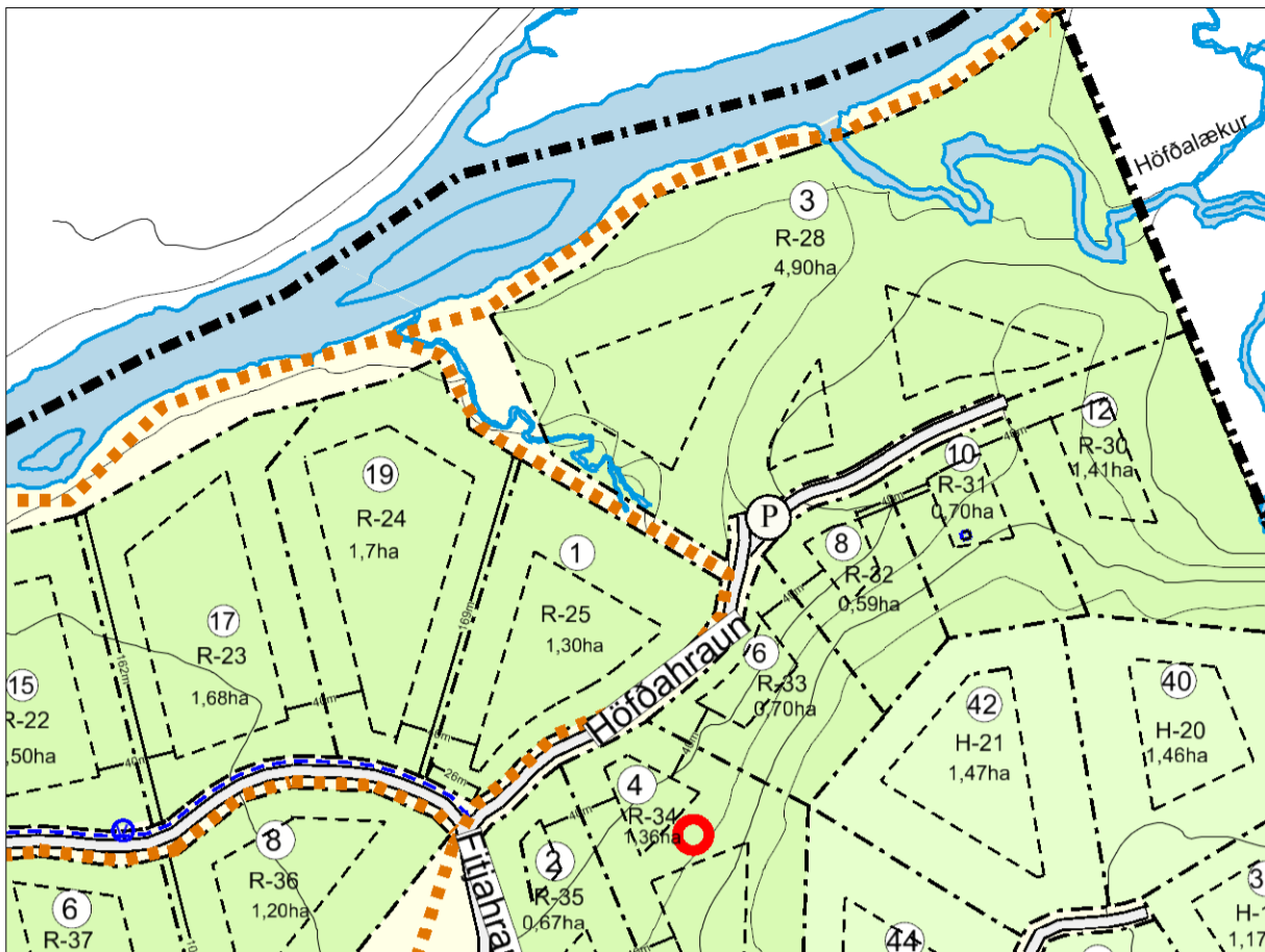
SAMÞYKKT DEILISKIPULAG FRÁ 4. apríl 2013