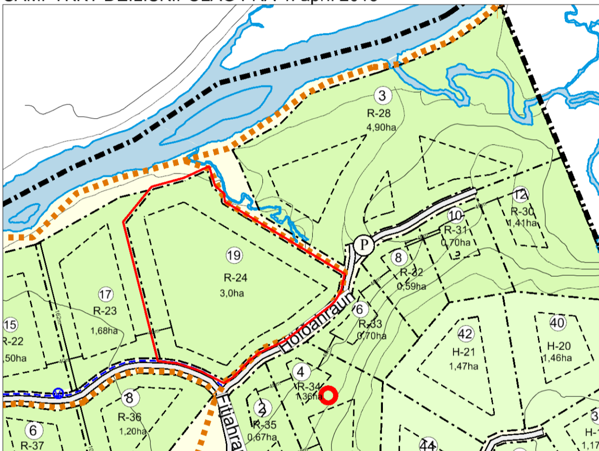
TILLAGA AÐ BREYTINGU Á DEILISKIPULAGI GREINARGERÐ

Endurskoðað deiliskipulag frístundabyggðar í landi Svínhaga, Heklubyggð var samþykkt í sveitarstjórn Rangárþings ytra þann xx. 2013. Nú er farið í óverulega breytingu á deiliskipulagi þar sem sameina á lóðir Höfðahrauns 1 og Fitjakrauns 19 og fær hin nýja lóð heitið Fitjakraun 19. Ástæða þess að farið er í þessa breytingu er að það er sami eigandi að báðum þessum lóðum sem vill nýta lóðirnar sameiginlega og staðsetja byggingar um miðbik landsins, nær lóðarmörkum milli Höfðahrauns 1 og Fitjakrauns 19 en 20 m eins og skilmálar deiliskipulagsins segja til um.