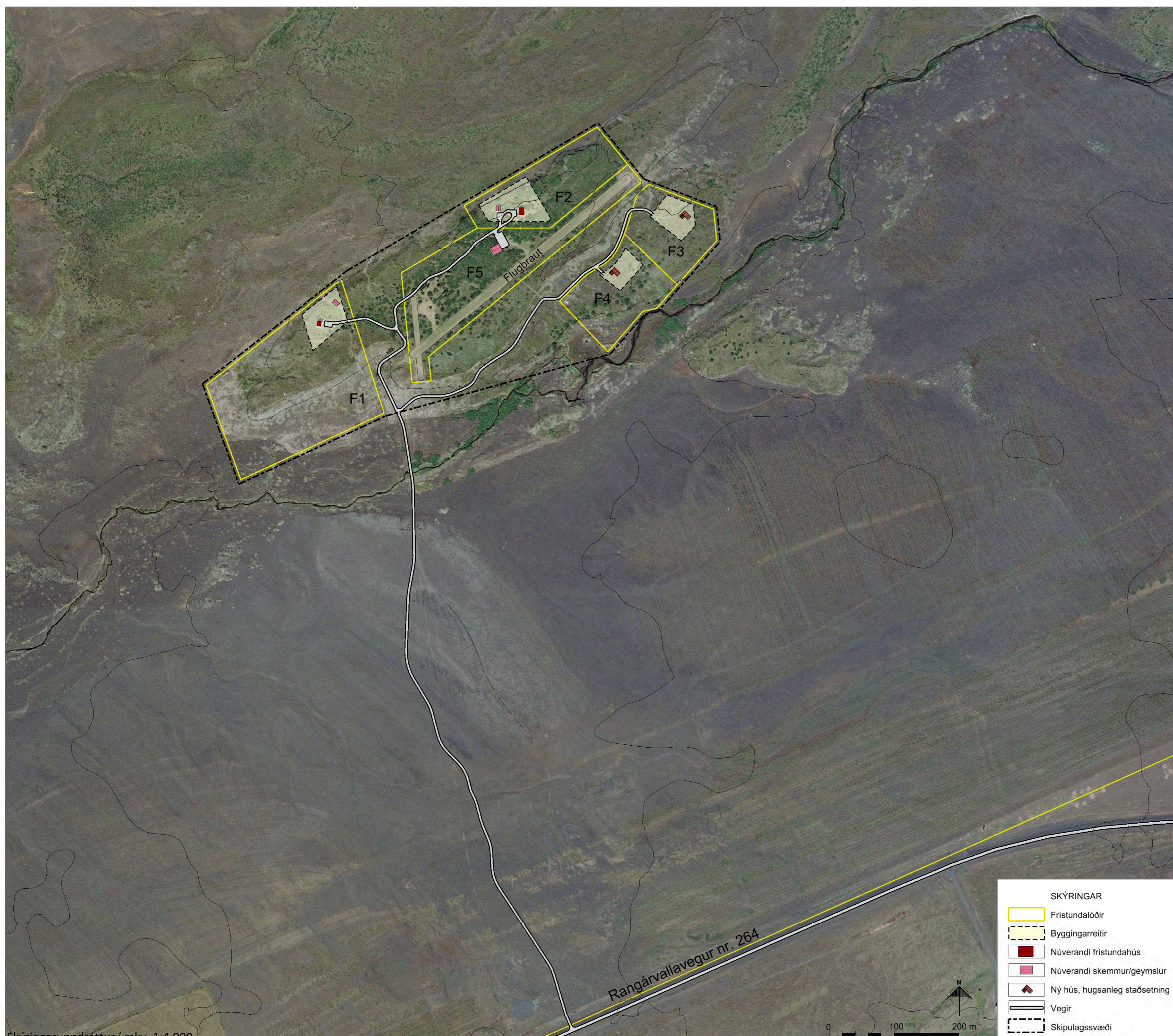
Skýringaruppráttur í mkv. 1:4.000.

Húsagerðir eru frjálssar að öðru leyti en því sem mæliblöð, skilmálar þessir, byggingarreglugerð og aðrar reglugerðir segja til um. Mænistefna er frjálss.