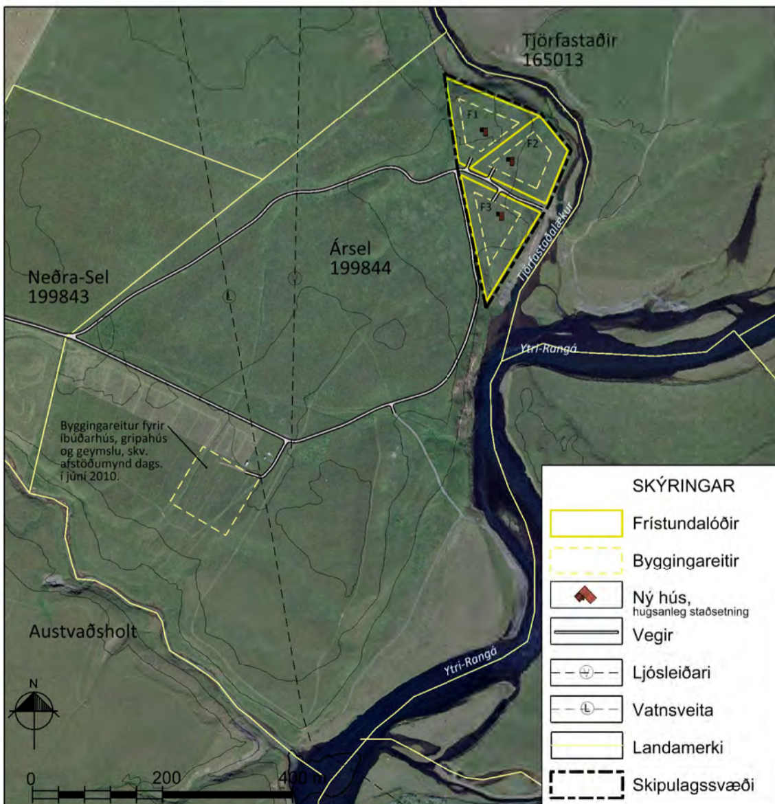
Skýringaruppdráttur í mkv. 1:4.000.