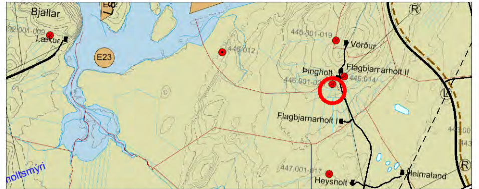
Aðalskipulag Rangárþings ytra 2010-2022. Mkv. 1:50.000.