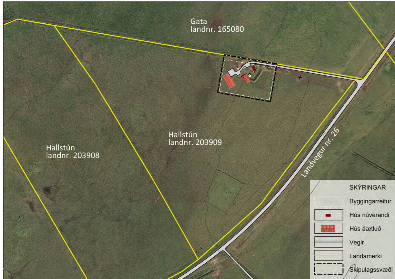
Skýringaruppdráttur mkv. 1:4.000.