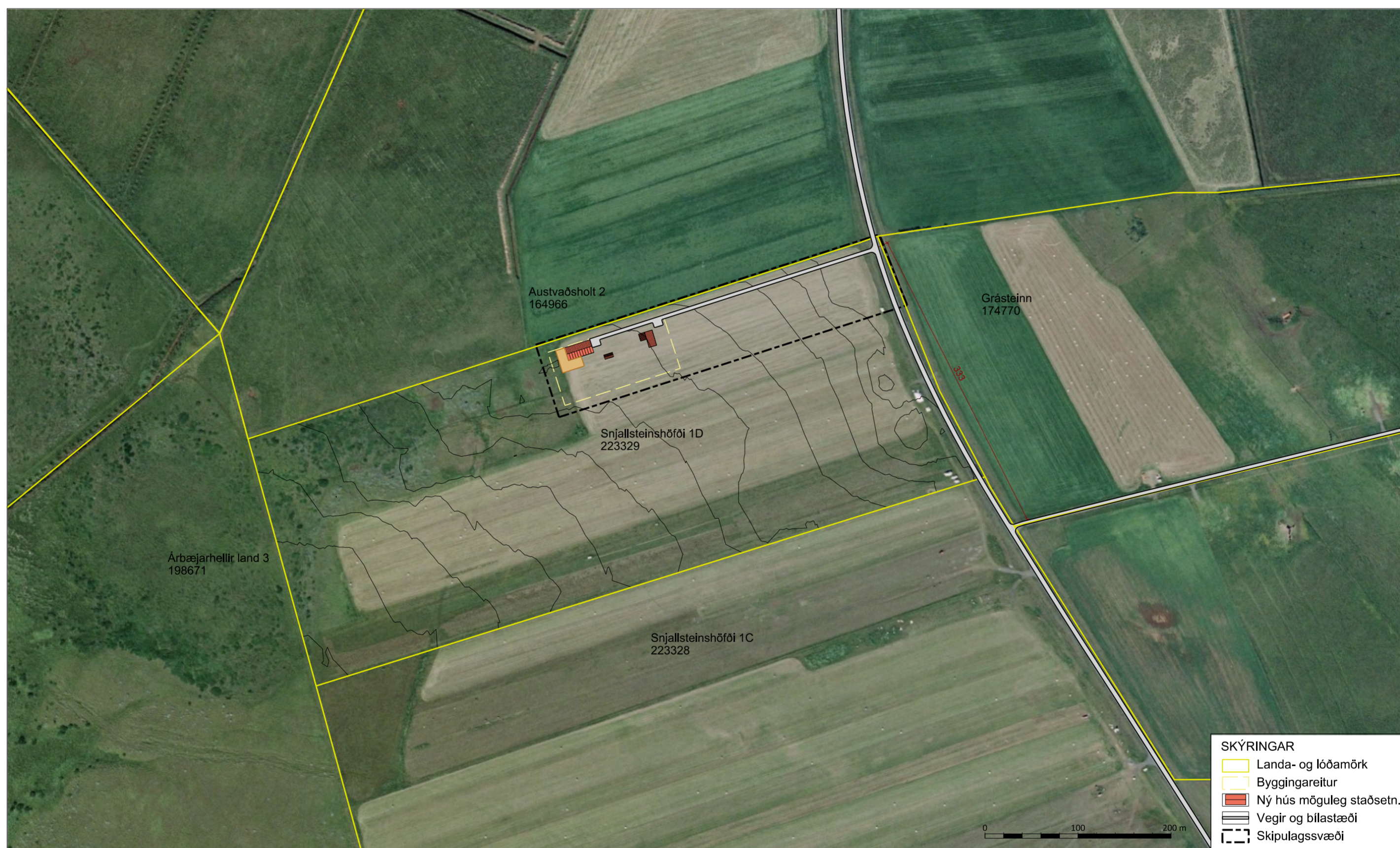
Skýringaruppráttur í mkv. 1:4.000.