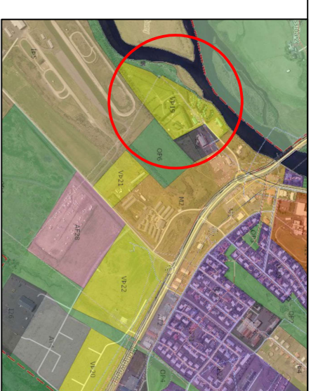
HLUTI AÐALSKIPLAGS HELLU 2016-2028