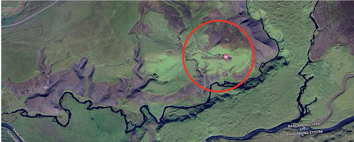
MYND 1. Skipulagssvæðið er innan rauða hringsins. Mynd frá Google maps.