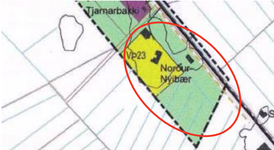
MYND 2. Hluti Aðalskipulags Rangárþings ytra 2016-2028 - þéttbýlisuppráttur Þykkvabæjar. Skipulagssvæðið er innan rauða hringsins.