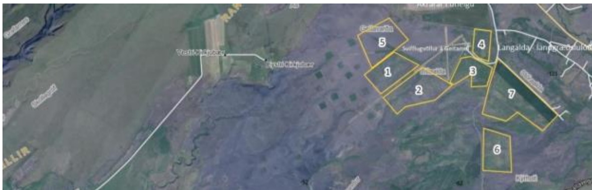
MYND 1. Akuryrkjussvæði, skv. umsókn um framkvæmdaleyfi, eru innan gulu flákana.

Engar þekktar minjar eru innan skipulagssvæðis. Svæðið er heldur ekki undir hverfisvernd.