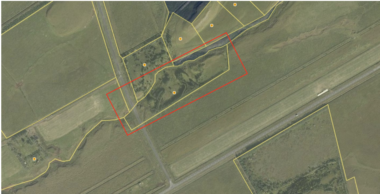
Mynd 1 Yfirlitsmynd af vef HMS. Spildan er innan rauða rammans.

Aðkoma að svæðinu er til norðurs frá Landveg (nr. 26) um Hagabraut. Gert er ráð fyrir núverandi aðkomuvegur að svæðinu verði nýttur með slóðum upp að húsum. Svæðið kemur til með að tengjast dreifikerfi RARIK og heitu vatni frá Veitum. Til skoðunar er hvort hægt sé að tengjast neysluvatni frá sveitarfélaginu eða hvort forsendur séu til staðar til að bora eftir vatni innan lóðar. Nánari skilmálar verða settir fram í deiliskipulagi fyrir svæðið.