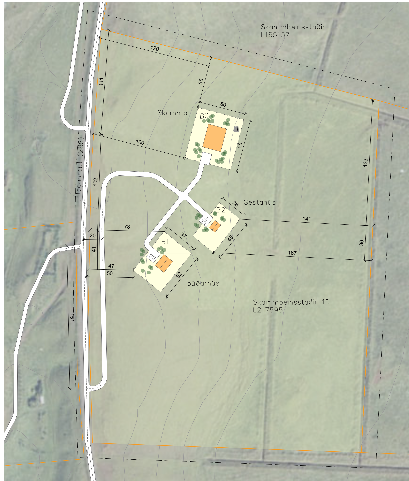
GILDANDI DEILISKIPULAGSUPPRÁTTUR 1:2000