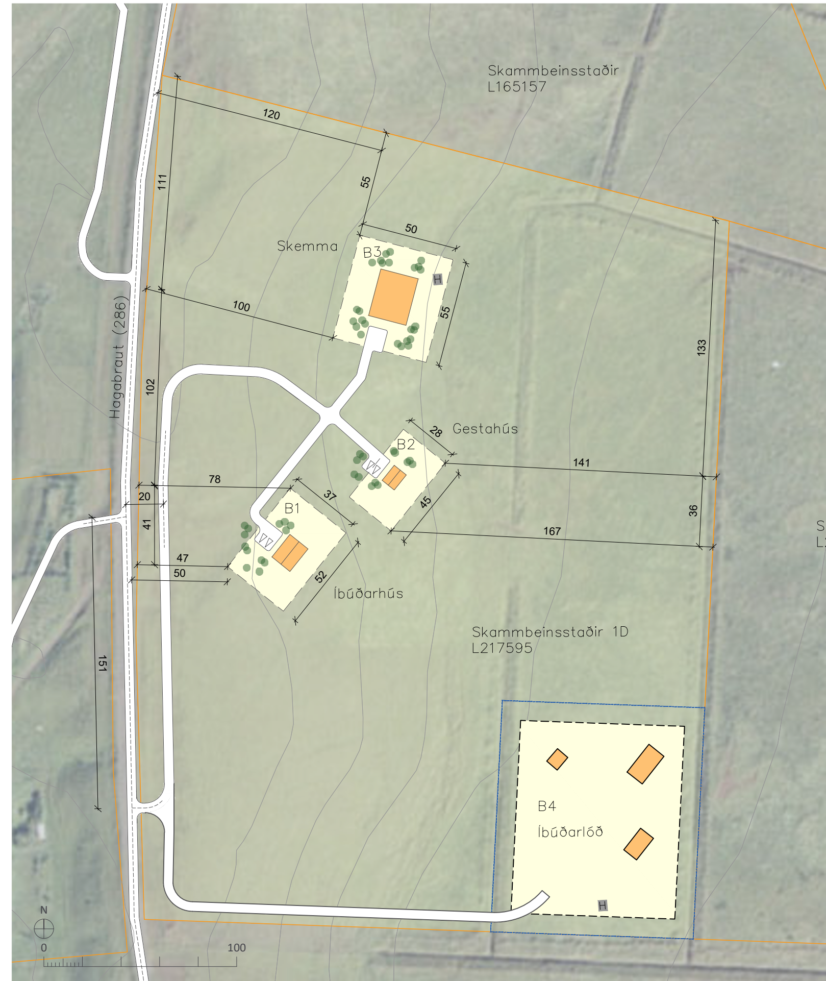
BREYTTUR DEILISKIPULAGSUPPRÁTTUR 1:2000

Umhverfismat fellur undir lög um umhverfismat framkvæmda og áætlana nr. 111/2021.