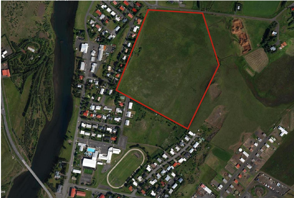
MYND 1. Yfirlitsmynd yfir svæðið. Svæðið innan rauðu afmörkunarinnar tekur breytingum.

hentar vel til að byggja upp framtíðar íþróttasvæði sveitarfélagsins. Það er rúmgott og stutt frá skóla og verður nokkuð miðsvæðis í þéttbýliskjarnanum þegar aðliggjandi íbúðarsvæði verða byggð.