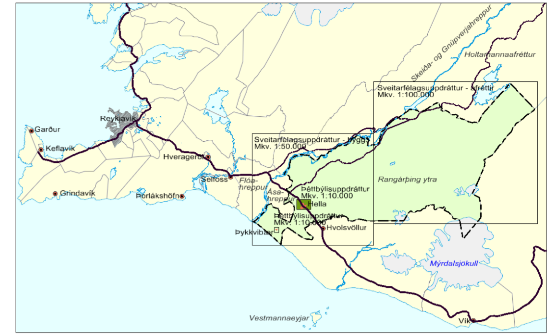
Afstöðumynd í mkv, 1:1.500.000.

Aðalskipulag 2016-2028 Þéttbýlisuppdráttur - Hella